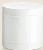
Détecteur de mouvement intérieur