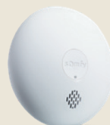
Détecteur de fumée